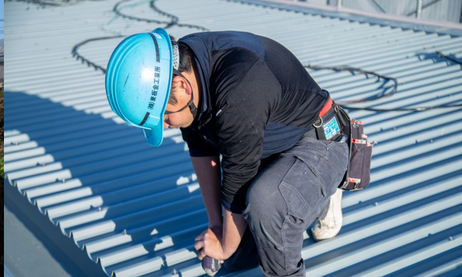
板金職人を目指した H君