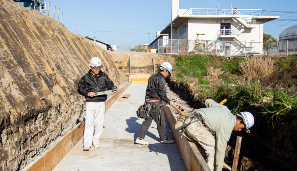
型枠職人を目指した K君