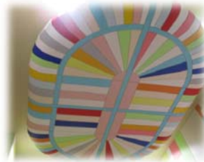
ダイノックシートを貼り、 Dボードのように目透し貼り 特殊天井完成