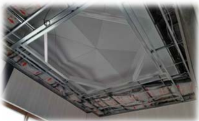
ケイカル板 捨て貼り