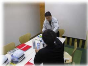
熱中症対策の指導