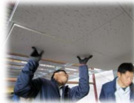
研修センターでの実務演習