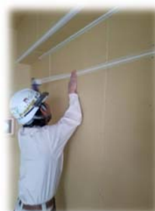
ファイバーテープ処理