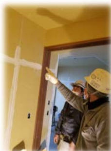
親方から指導を受ける