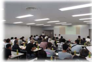
会場を借りての座学