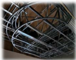
役物天井下地施工状況