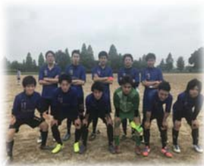
レクリエーションの様子