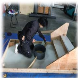
3日目：本番と同様に計測し、 採点・諸注意事項等、講師の方にして頂く