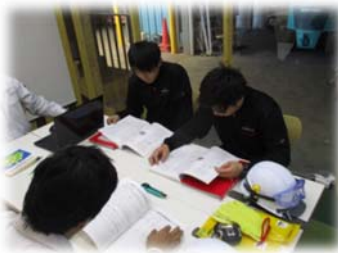
内装仕上工事ガイドブック による講習