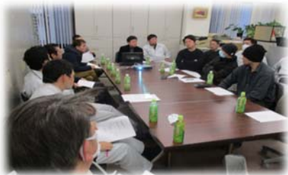
社員と職方による検討会