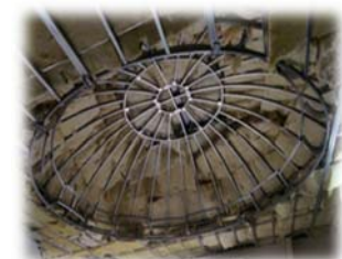
ドーム型天井下地