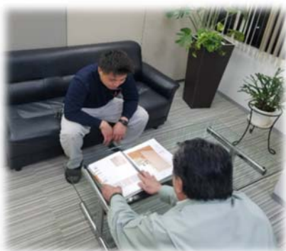
フォローアップ研修、月例面談