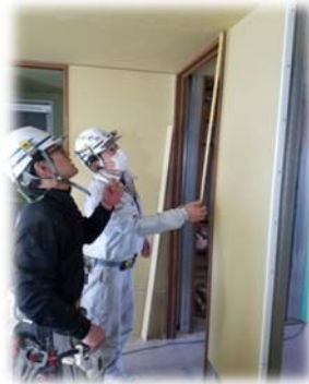
ビスピッチの指導を受ける