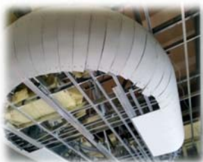
曲がるケイカルと FGボードで施工