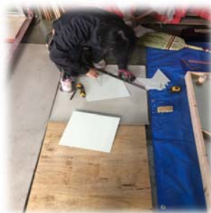
2日目：実際に施工し、終了時には 納まりの不具合の確認