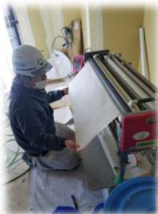
のり付け機での作業