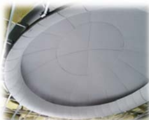
曲がるケイカルで施工