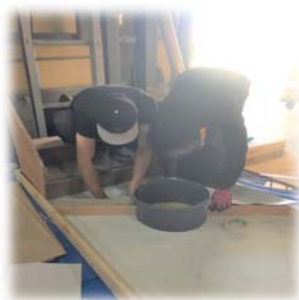
1日目：試験内容と材料の 取り方などの確認