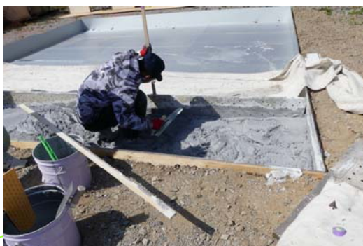
《土間コンクリート均し訓練》