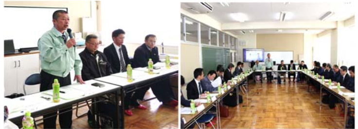
≪ メーカー連携会議準備会開催 ≫ 33社参加