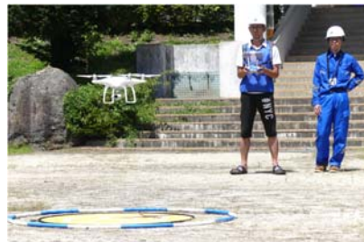
《ドローン技能訓練》