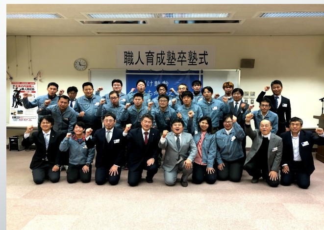
第七期卒業生 18名卒業 (女性3名)