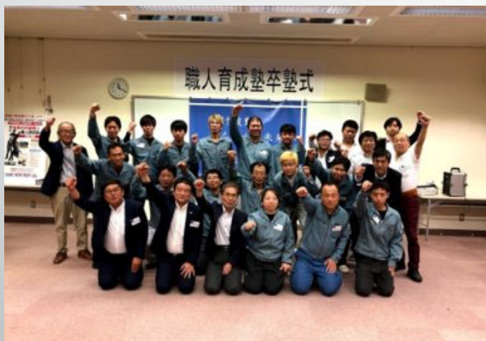
第六期卒業生 15名卒業 (女性1名)