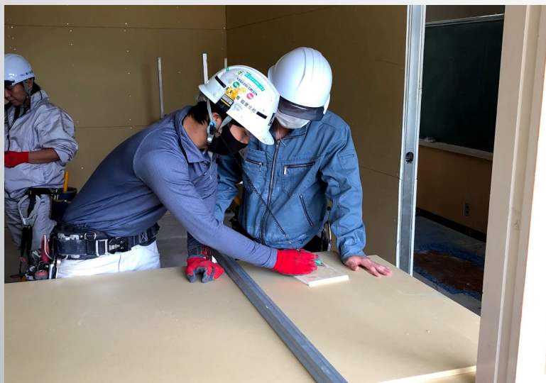
軽天・ボードの採寸取りの説明