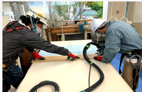
ボードの切り付け