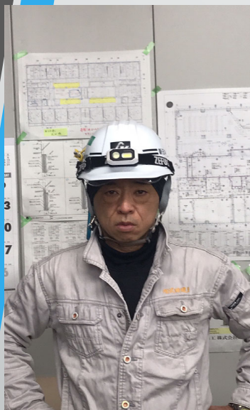
50代前半（軽鉄・ボード工） 経験年数30年

* 内装仕上げ業種9業種の多くの職人・親方が育成塾の訓練に参加する事で意識改革を体験