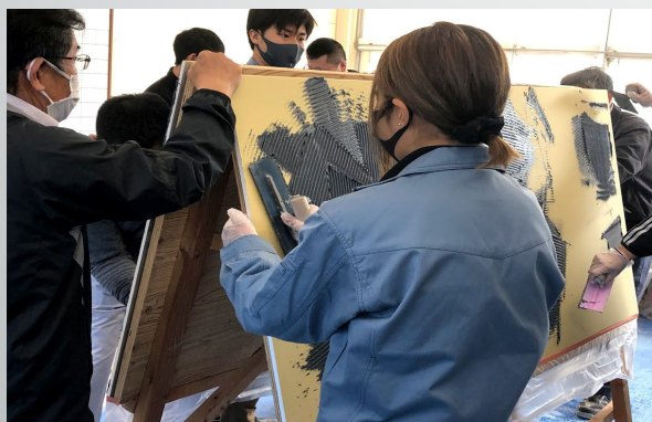
タイルのボンド付け