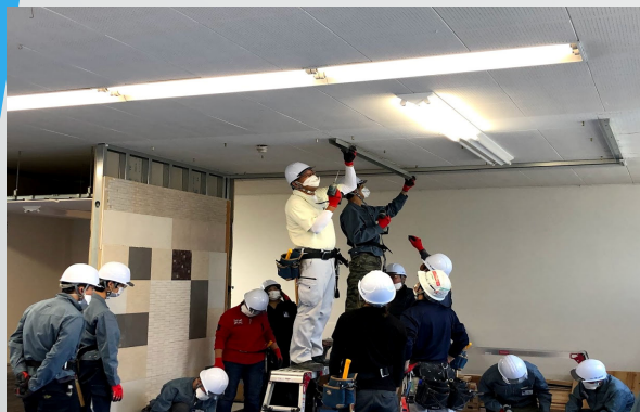
軽鉄・ボード下地の取り付け