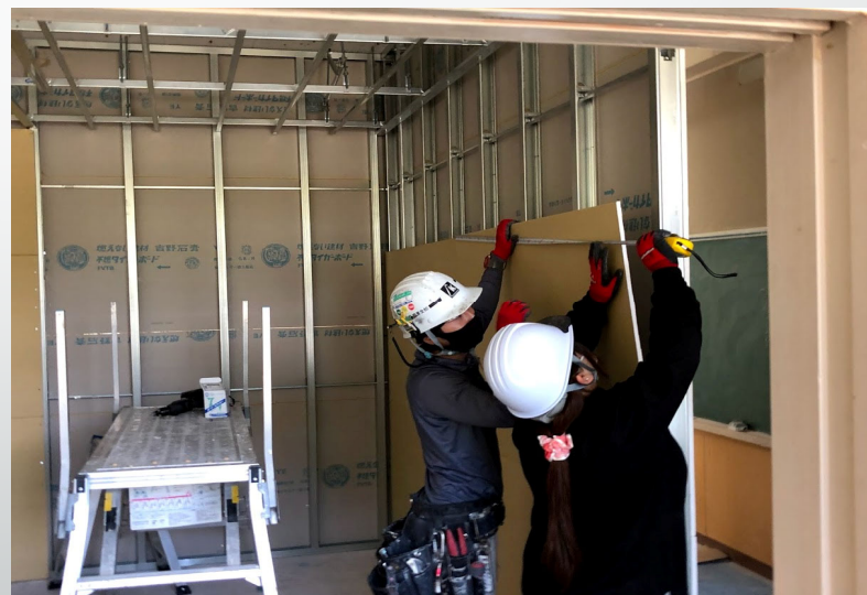
採寸後、現場貼り付け